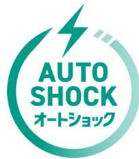
オートショック AED ロゴマーク

電気ショックボタンがなく、電気ショックが必要なときに 自動で電気ショックを実行する AED